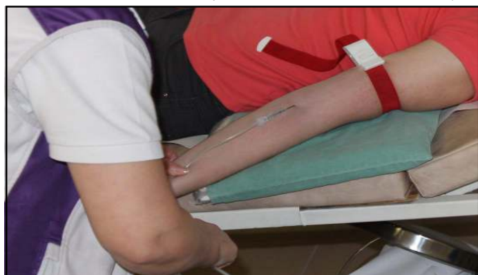
Časť protestujúcich učiteľov prišla na HTO darovať svoju krv.