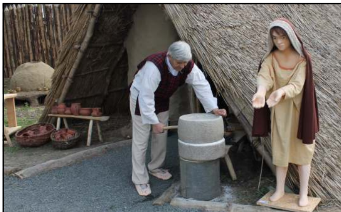
Prehliadkou Archeoparku návštevník prejde vyše 30 000 rokov v čase. V každom objekte si sám môže skúsiť rôzne činnosti.

nost Majeroviec pre školy nebola o nič lepšia ako Hanušovce a pre nízku návštevnosť, ale najmä pre silné podmácanie zle zrekonštruovaného objektu a nezdravé prostredie bola vysunutá expozícia v roku 1996 zrušená. Od roku 1994 sa postupne začala vytvárať expozícia Dobovo zariadené interiéry , čím múzeum aspoň čiastočne splatilo svoj dlh objektu, v ktorom sídli, a návštevníkom ponúklo tri miestnosti zariadené dobovým nábytkom. Zároveň sa rozsiahlymi zásahmi do horného foyeru a chodieb vytvorili priestory pre intenzívne sa rozvíjajúcu výstavnú činnosť. Významný posun v expozičnej činnosti múzea predstavuje expozícia etnografie Duch národa , otvorená v roku 2004 v adaptovaných priestoroch na poschodí hospodárskej budovy pri Malom kaštieli. Na prízemí tejto stavby bola premenená konzervátorská dielňa na Diel-