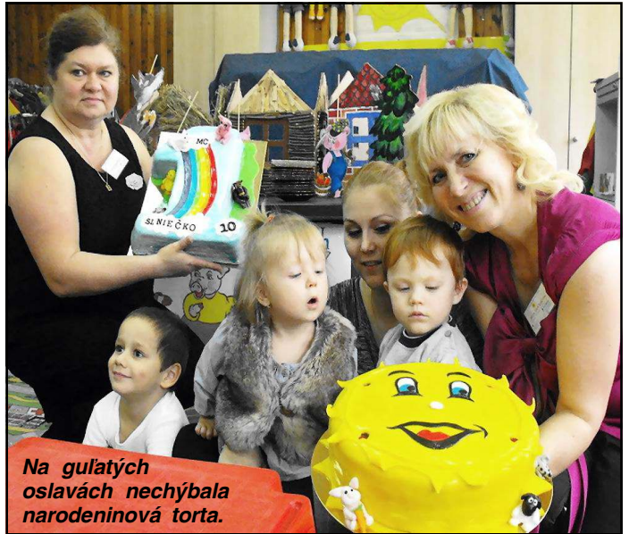
Na gulatých oslavách nechýbala narodeninová torta.

miera nezamestnanosti vypočítaná len z disponibilných uchádzačov klesla z 19,65 % v septembri na 17,48 % . Najväčší vplyv na pokles miery nezamestnanosti mal vysoký počet evidovaných uchádzačov zaradených na menšie obecné služby, migrácia za prácou a vysoký počet maródov. V podstate ide o to, že ak by lekári vypísali na maródku ďalších 6700 nezamestnaných, okres Vranov by vykázal mieru nezamestnanosti 0 %. Úradnícky by to bol vynikajúci úspech, ale reálne by to bol štatistický nezmysel. Ku koncu mesiaca bolo v evidencii aj 523 absolventov škôl, z toho 157 vysokoškolákov a 366 stredoškôľakov. Úrad práce mal nahlásených 432 voľných pracovných miest, z toho 117 miest bolo vhodných pre absolventov škôl a 15 pre občanov so zdravotným postihnutím. Z pohľadu vzdelania, najväčší záujem zo strany zamestnávateľov bol o pracovníkov s nižším odborným vzdelaním (209 pracovných miest), najmenší o pracovníkov s vyšším a vysokoškolským vzdelaním.