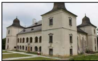
Sídlo Vlastivedného múzea.

ne nemysliteľné. Múzejne i odborné prepracovanejšia a kvalitnejšia expozícia Prírodné pomery okresu Vranov nad Topľou bola sprístupnená v roku 1983 a s malými obmenami pretrvala až do roku 2010. Pokusom vyvážiť nešťastné situovanie okresného múzea mimo okresné mesto bolo v roku 1989 sprístupnenie expozície poľnohospodárstva Človek a pôda v klasicistickej kúrii v Majerovciach. Dobrá myšlienka však nenašla dobrú odozvu. Dostup-