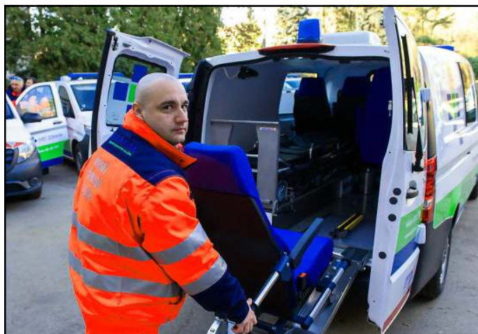
Nové vozidlá sa vyznačujú väčším komfortom a bezpečnosťou.