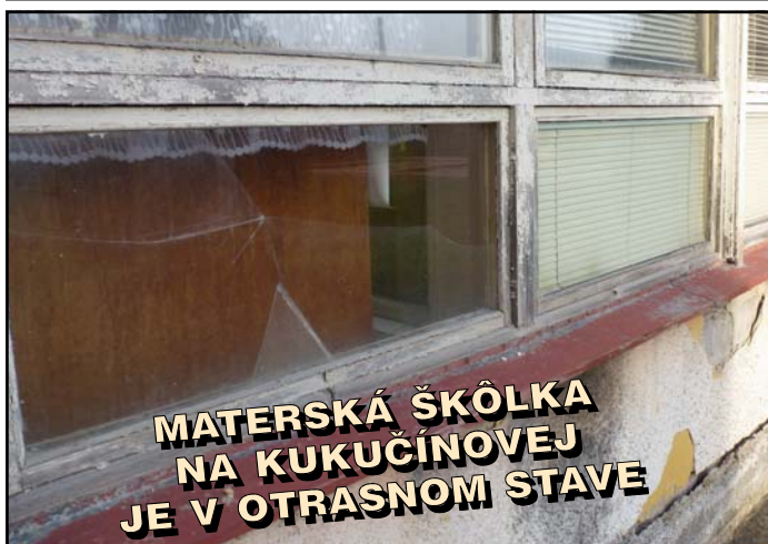
Primátor s platom 3334 € sa nehanbí za rozbité a zhnité okná?