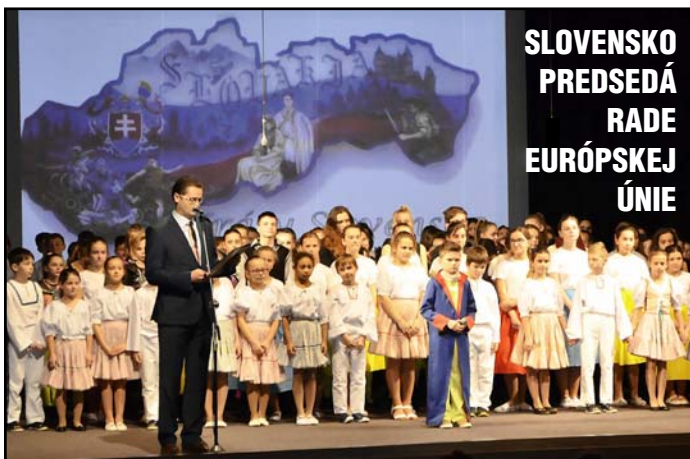
SLOVENSKO PRESEDÁ RADE EURÓPSKEJ ÚNIE