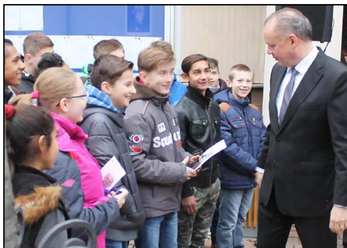
Uvítania hlavy štátu sa zúčastnila len školská mládež, lebo tzv. najtransparentnejšie mesto informáciu médiám vopred neposkytlo.